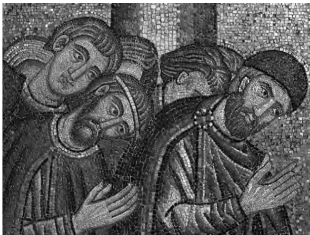
Мозаика. Собор Сан-Марко. Венеция. XI в.

Собственно, эта практика и была центром их жизни: деятельность спудеев, все их дела, труды, заработки были этому принципу совершения богослужения подчинены. Спудеи имели возможность совершать все богослужения в течение дня, и совершать их в положенное время. Монашеский идеал непрестанной, целодневной, целонощной молитвы и естественное для харизматических времен стремление к молитве ночной или предрасветной они соединили с ветхозаветным наследием – молитвой в определенные часы дня.